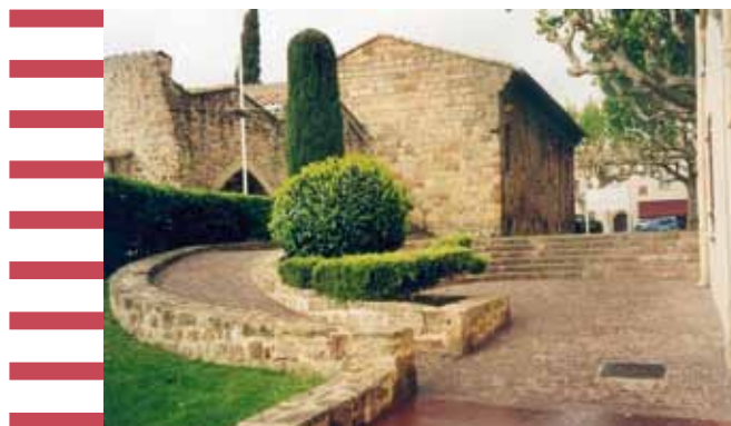
Exemple d'une intégration architecturale réussie d'une rampe d'accès dans un environnement préservé.

commun, volonté de créer des zones de rencontre ou de réduire la circulation automobile, demandes d'association, etc.).