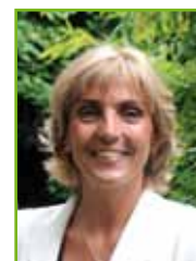
Valérie Létard, secrétaire d'État auprès de Jean-Louis Borloo, ministre d'État

Madame, Monsieur le Maire, c'est ensemble que nous pourrons peu à peu réussir le grand chantier de l'accessibilité.